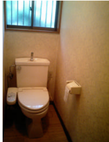
施工前・・・時代を感じさせる花柄のクロス

便座なしです。 普段手の届かない 所もピカピカ にお掃除しました。 掃除に時間を 費やしすぎたかも。